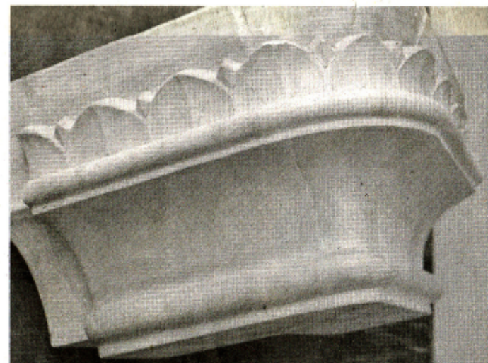
SÁDROVÝ, RUČNĚ VYROBENÝ MODEL KACHLE pro repliku kamen, ze kterých se zachovala jen jedna oprýskaná kachle a místo, kde stávala.

Umění, třeba obraz, obohacuje člověka na duchovní stránce, ale sám o sobě nic nepřináší. Totéž hudba, je krásná, člověka povznese, ale jakmile dozní, nic z ní není. Tady, v našem řemesle, se